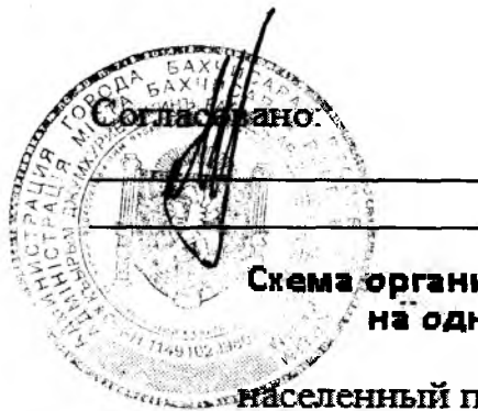
Схема организации движения и ограждения мест производства работ на одной полосе движения в населенных пунктах

населенный пункт: г. Бахчисарай: ул. Советская